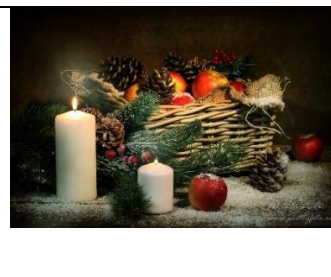
А) Новый год